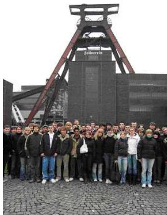
Exkursion ins Ruhrgebiet