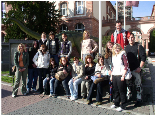
11er im Senckenberg- museum in Frankfurt

Die Schülerinnen und Schüler erreichen mit Bahn- bzw. Busverbindungen aus vielen Orten die Schule. Die Rückfahrten erfolgen selbstverständlich nach dem regulären Unterrichtschluss und nach dem AG-Unterricht. Des Weiteren ist unsere Schule durch die Bahn sehr gut angebunden. Es besteht vor und nach dem Unterricht eine Busverbindung zum Bahnhof.