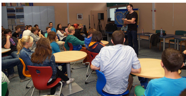
Autorenlesung Poetry Slam