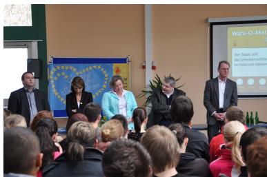
„Politiker im Unterricht“ (Wahl-o-Mat 2012)