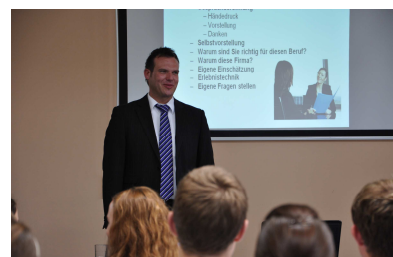
Bewerbertraining in Klassenstufe 12