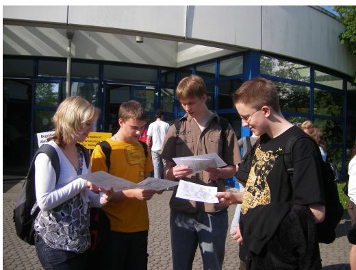
Oberstufenschüler auf dem Techno-Tag / Uni KL