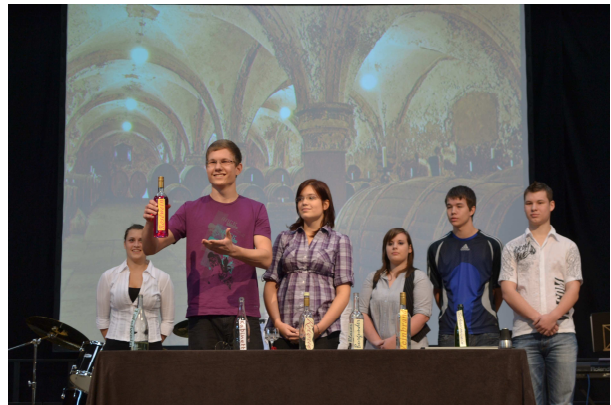
„Die Alchemisten“ des Chemie-Kurses